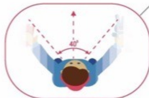
ОПАСНОЕ ТУННЕЛЬНОЕ ЗРЕНИЕ

При переходе проезжей части обязательно держите ребёнка за руку и первым делом научите разворачиваться и смотреть по сторонам: сначала налево, потом направо, а дойдя до середины дороги – снова направо!